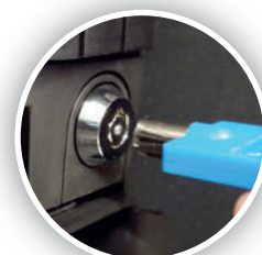
Bloqueos interiores de acceso al efectivo (opcionales)