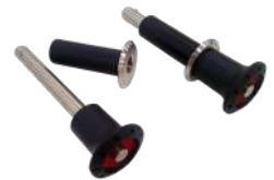
Sistema de anclaje desmontable (opcional)