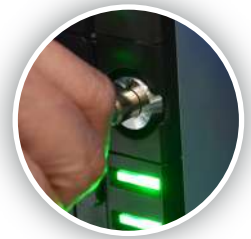
Bloqueos interiores de acceso al efectivo